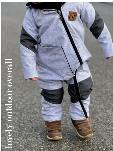
lovely outdoor overall