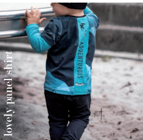
lovely panel shirt