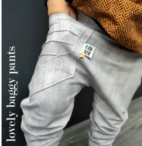
lovely baggy pants

Kennt ihr schon? meine anderen Schnittmuster.